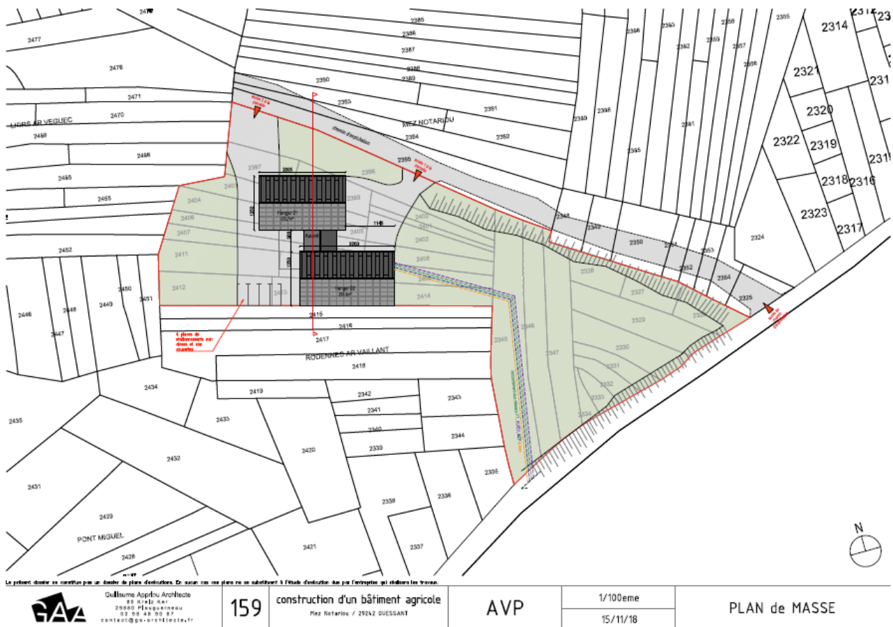
Plan de masse du bâtiment en projet sur le site de Mez Notariou (version du 15 novembre 2018)

Ces bâtiments seront aménagés par le candidat en fonction des besoins identifiés. Ils resteront de la propriété de la commune et seront loués aux candidats (loyer non encore défini). Une mutualisation des espaces et de leurs fonctions pourra être envisagée le cas échéant avec le maraîcher. A noter l'absence d'installations dédiées à la traite dans le bâtiment d'exploitation.